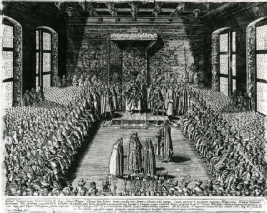
rys.6. Prezentacja królowi i stanom Rzeczypospolitej cara Wasyla Szuskiego i jego braci, w Sali Senatorskiej Zamku Królewskiego w Warszawie 29 października 1611 roku. Miedzioryt Tomasza Makowskiego wg obrazu Tomassa Dolabelli, po 1611.