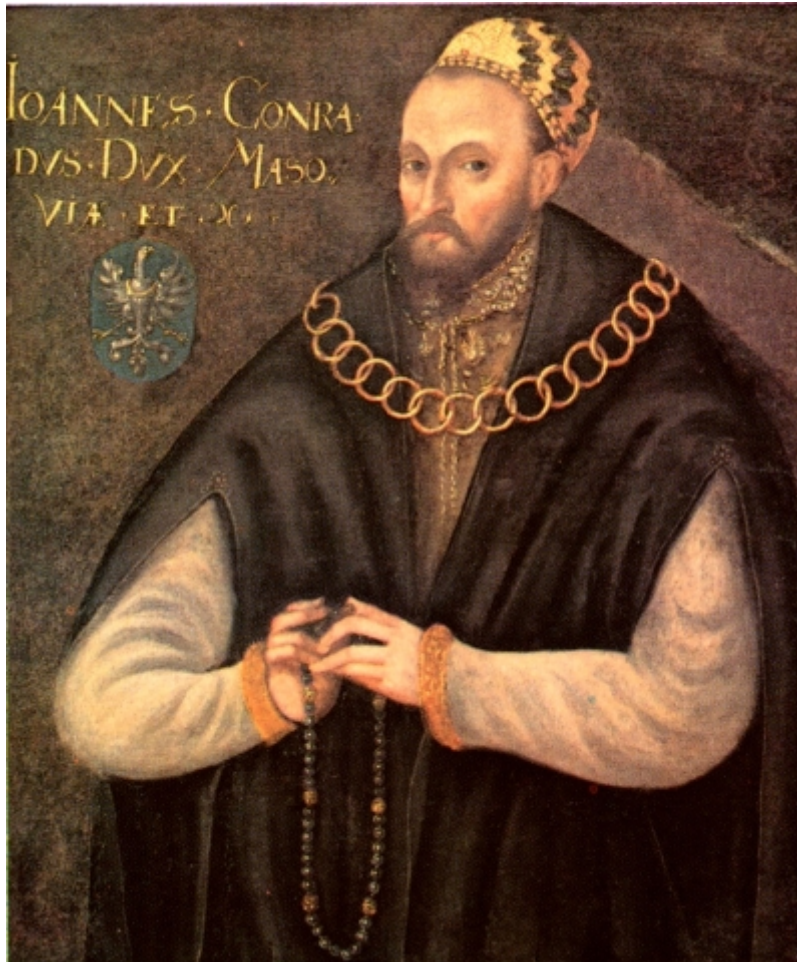
Portret Konrada III, ks. mazowieckiego, malarz polski, 3. ćw. XVI w., or.: Muzeum w Wilanowie; kopia XX w., Zamek Królewski w Warszawie