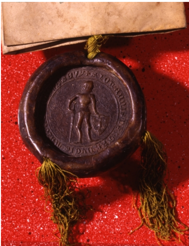
Pieczęć Janusza I Starszego, księcia wiskiego i warszawskiego przy dokumencie z 1379 r., wł.: Archiwum Główne Akt Dawnych, fot. M.Bronarski, Archiwum Zamku Królewskiego.