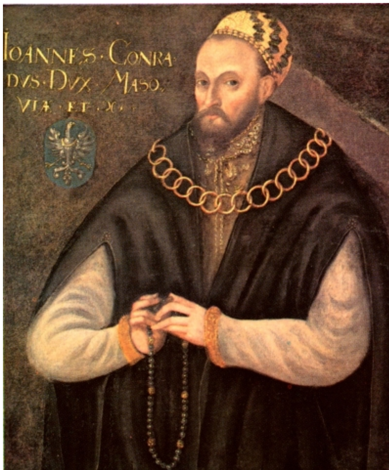
Portret Konrada III, ks. mazowieckiego, malarz polski, 3. ćw. XVI w., or.: Muzeum w Wilanowie; kopia XX w., Zamek Królewski w Warszawie