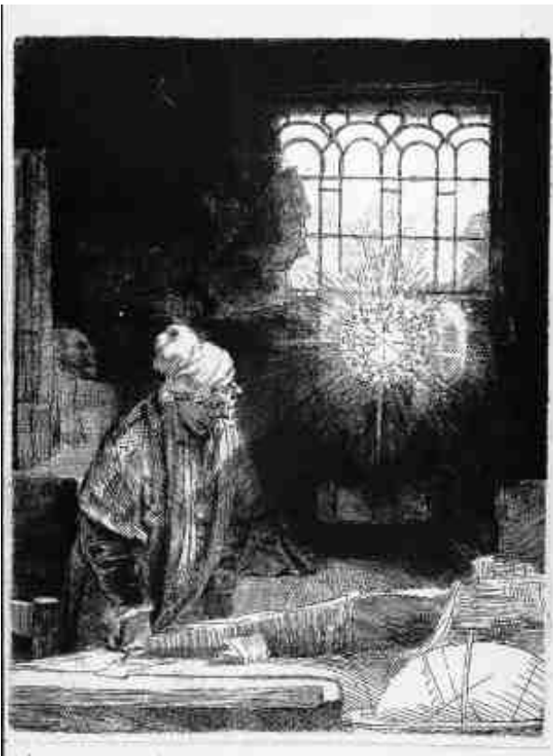
Faust , około 1652, akwaforta, sucha igła i rylec, stan II, 210 x 160 mm.

akwaforta z suchą igłą i rylec, stan II, 278 x 388 mm.