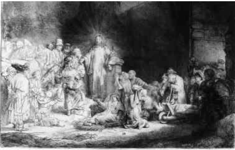
Chrystus nauczający ("Rycina Stuguldenowa"), około 1643 – 49,

akwaforta z suchą igłą i rylec, stan II, 278 x 388 mm.