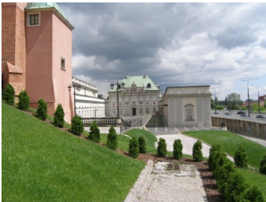
Pałac Pod Blachą; fot.K.Stobiecki

Elewacja otrzymała nową historyczną kolorystykę, a rzeźby i namalunki poddane gruntownej konserwacji. Wyremontowany i unowocześniony technicznie pałac Pod Blachą oraz nowy bogaty program muzealny i oświatowy realizowany w jego wnętrzach stają się atrakcyjną propozycją skierowaną do wszystkich grup wiekowych mieszkańców Warszawy i dla turystów odwiedzających Stolicę, a zwłaszcza Stare Miasto wpisane na listę światowego dziedzictwa kulturowego UNESCO.