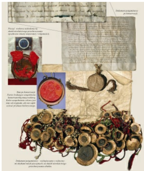
rys.2. Konserwacja dokumentów pergaminowych z pieczęciami woskowymi