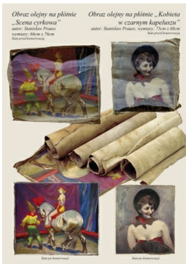
rys. 5. Obrazy olejne: "Scena cyrkowa", autor: Stanisław Prauss "Kobieta w czarnym kapeluszu", autor: Stanisław Prauss

W 2008 roku zakończono prace przy projekcie rentgenografii przenośnej – cyfrowej. Urządzenie to pozwoli na bezpieczną pracę w terenie i obniży znacznie koszty oraz poprawi jakość wykonywanych prac konserwatorskich.