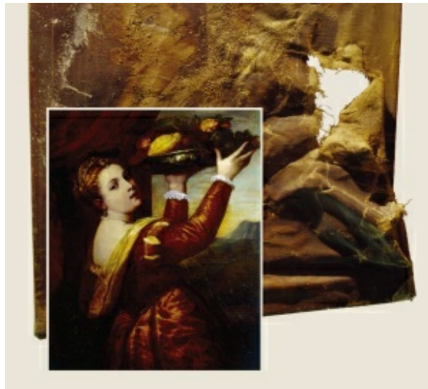
rys. 1. Dziewczyna z koszem owoców Tiziano Vecelli (Tycjan) 1488 – 1576 obraz olejny – kopia wykonana w 1920 roku, zniszczona podczas działań wojennych w 1945 roku. Deformacja całej powierzchni z licznymi rozdarciami i ubytkami płótna, zaatakowana koloniami pleśni i grzybów. Stan przed konserwacją i po niej

A oto, jak o swojej pracy opowiadali autorzy wystawionych dzieł: