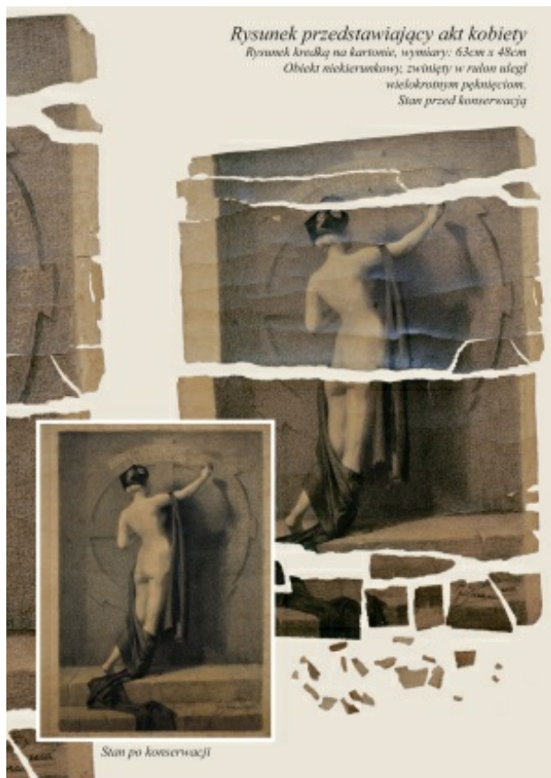
rys.4. Rysunek przedstawiający akt kobiety Rysunek wykonany kredką na kartonie, wymiary: 63cm x 48cm Obiekt niekierunkowy, zwinięty w rulon uległ wielokrotnym pęknięciom.

oraz wiele obrazów olejnych, rysunków, plakatów, dyplomów, listów, druków